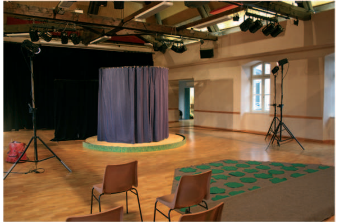
Vue d'ensemble de la structure (autonome)